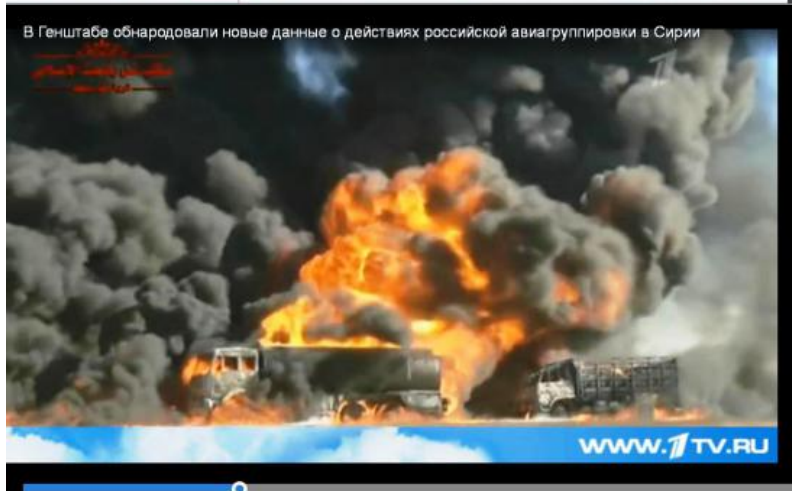
В Генштабе обнародовали новые данные о действиях российской авиагруппировки в Сирии